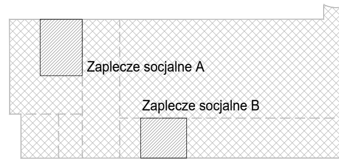
Schemat lokalizacji zapleczy